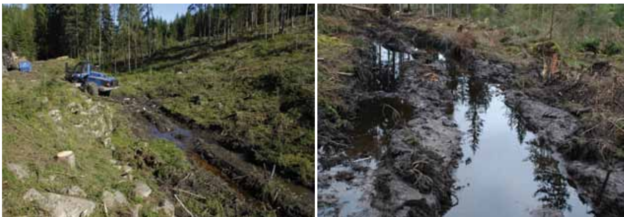
Figur 3. Tunga skogsmaskiner orsakar skador på många källor och källvattendrag.