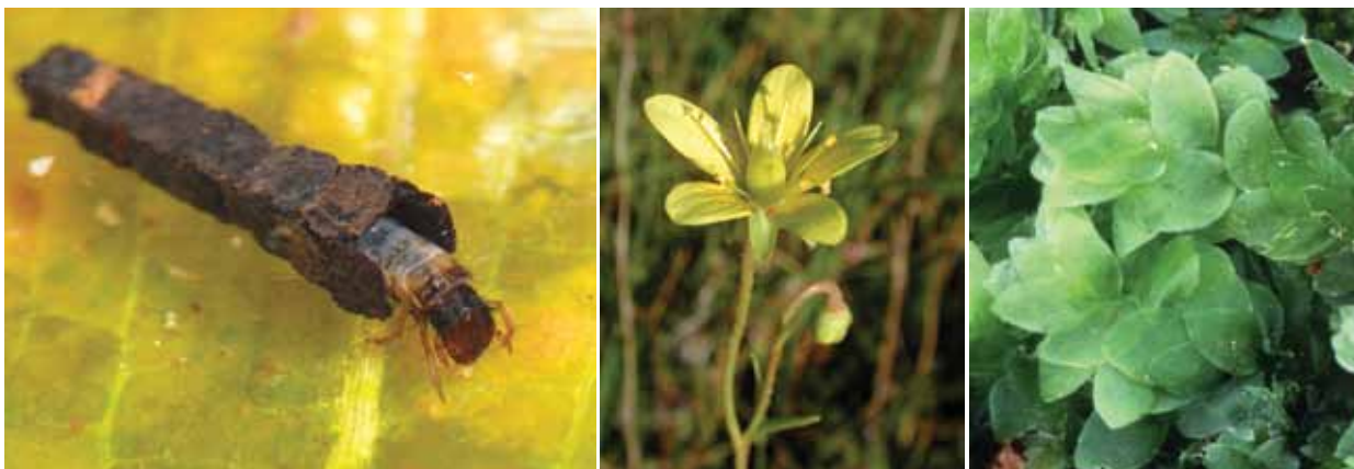
Rödlistade källvattenarter. Nattsländan Crunoecia irrorata , myrbräcka och skirmossa.